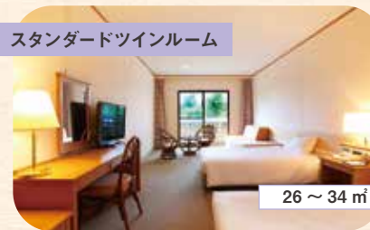
スタンダードツインルーム