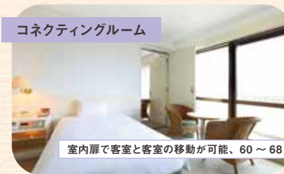
コネクティングルーム