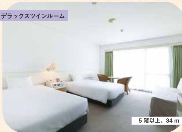
デラックスツインルーム