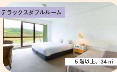
デラックスダブルルーム