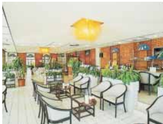
ティーラウンジ「ティーダ」