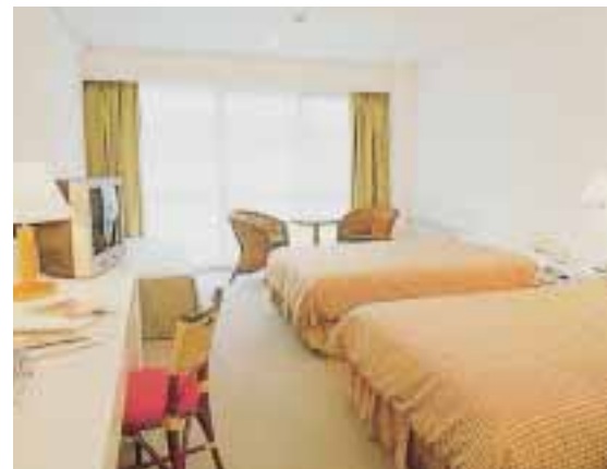
客室（デラックスツイン/ノースタワー）