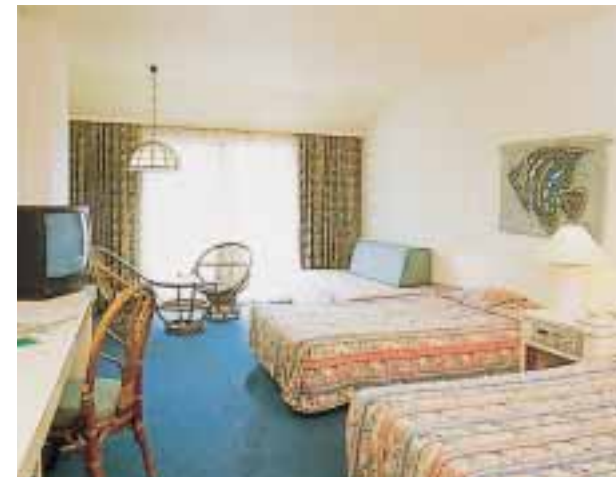
客室（デラックスツイン）

ゆったりとしたルームスペース。そして、開放的な広い窓とサンテラスから、表情豊かな南国の景色が広がります。