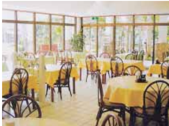
レストラン「アカバナ」

和食・洋食はもちろん、夏はプールサイドでバーベキュー、冬は久米島特産の車海老を使ったお料理をお楽しみください。